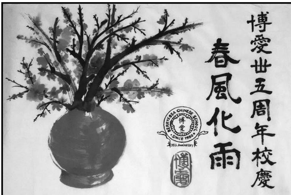
← 3rd winners C11&12 class students