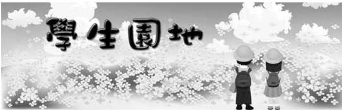
指導老師: M11 羅月美老師